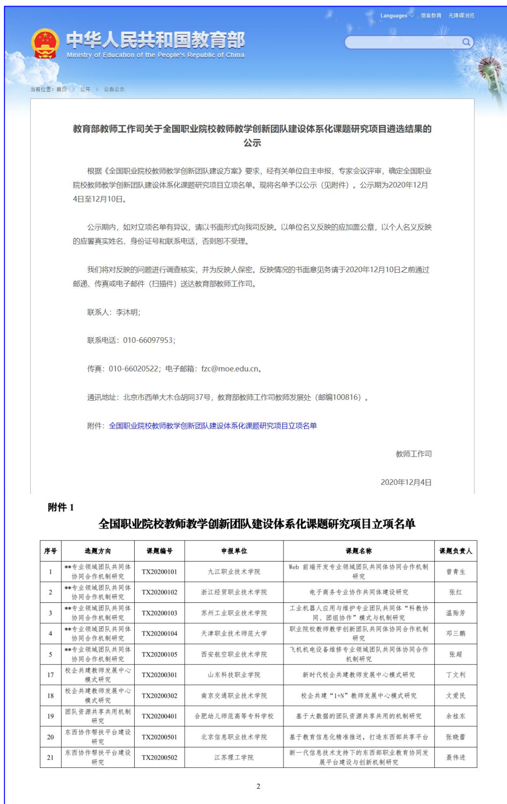
图 4-13 《新时代校企共建教师发展中心模式研究》立项通知